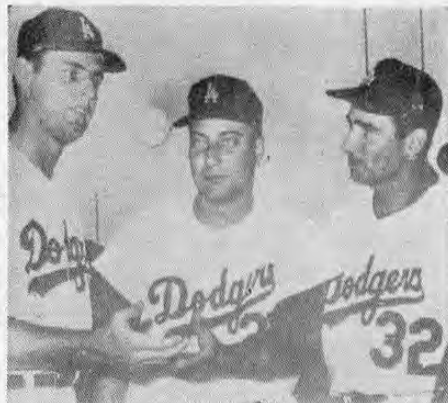
Las grandes esperanzas de los Dodgers de Los Angeles para ganar de nuevo la Serie Mundial están en el brazo de sus pitchers estrellas Sandy Koufax y Don Drysdale. Aquí se ven en compañía del mánager Walter Alton en amable charla jugando con una pelota. Hoy dará comienzo la tradicional competencia anual del beisbol de las Grandes Ligas y será el alto Don Drysdale quien abra la serie para los angelesinos que son favoritos de los entendidos.