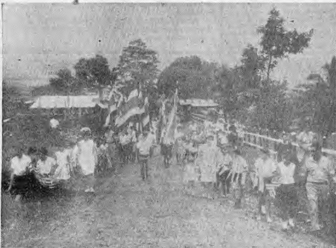
DESFILE ESCOLAR EN LA PALMERA DE SAN CARLOS — Niños de la Escuela de La Palmera en el Cantón de San Carlos desfilan acompañados de sus maestras y vecinos de la comunidad du-

rior ni se está haciendo nada por el estilo. Sólo se está estudiando una propuesta que tiene aspectos atractivos para el país. Uno de ellos: posibilidad de contar en 1969, año del centenario de la enseñanza gratuita y obligatoria, con aulas suficientes para todos los escolares costarricenses.