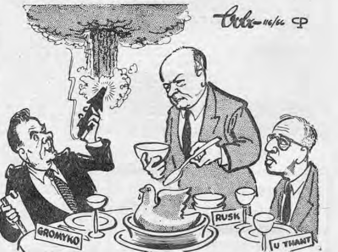
Nada para mí. Yo sólo quiero un puro como postre.

El Mariscal retirado Arthur Da Costa e Silva fue elegido por 295 miembros del Congreso. No tiene oposición.