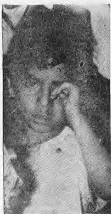
Este es el niño que dos autoridades, conociendo su difícil problema de agresión, no recibió atención de éstas. Lloró. Pero ni esas infantiles lágrimas merecieron la atención de los referidos funcionarios.

Unos quinientos niños, todos, menores de ocho años, están dedicándose a la mendicidad por el mal estado económico y las condiciones sociales de sus familias. Desde temprano en la mañana, hasta la medianoche la ciudad de San José se ve abarrotada, en el centro y en los barrios, por cientos de mendigos, en su mayoría, por niños en edad escolar que no están asistiendo a escuelas, aunque la Constitución advierte que la enseñanza es gratuita y obligatoria. Muchos se dedican a limpiar zapatos, otros a pedir cinco, comida y ropa vieja. Un ejemplo fue presentado ayer por muchos ciudadanos, en frente de la Catedral, cuando un niño de cinco años era maltratado por su hermano menor. La causa; no había recogido lo suficiente. Intervino un tráfico, paró una radiopatrulla, de placas 142. Allí, el Sargento se negó a intervenir en el caso o llevar al niño a la institución que corresponde, al Patronato Nacional de la Infancia, para la investigación del caso. El Sargento dijo: "Como es,