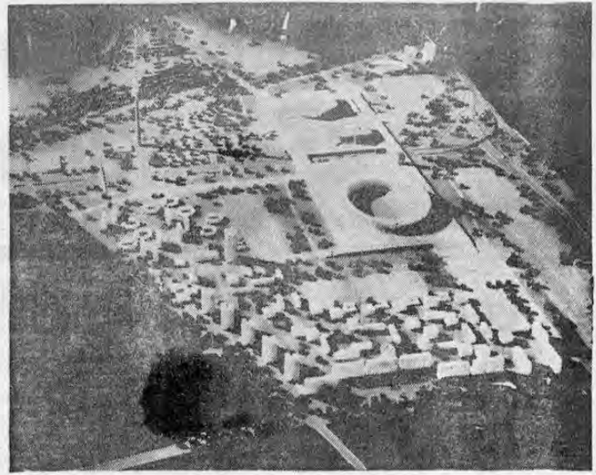
La ciudad de la Olimpiada de 1972, todavía en maqueta, pero pronto realidad. El Estadio tendrá cabida para 100,000 espectadores. En sus proximidades se construirán un campo de deportes con 12,000 localidades, una zona de natación con 10,000, una pista para carreras, ciclistas para —

Entendemos que por ser hijo de nicaraguenses puede defender los colores de ese hermano país en las próximas eliminatorias del campeonato centroamericano y del Caribe de Fútbol en que participará la selección pinolera con las de Guatemala, Panamá, El Salvador y Costa Rica.