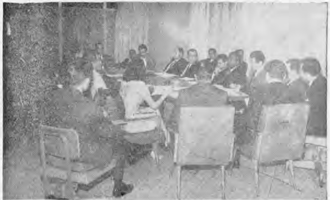
Más de dos mil empleados bancarios constituirán una Federación Nacional. La entidad tendrá como propósito — entre otros — el mejoramiento profesional y cultural de sus afiliados. En la gráfica se puede apreciar una de las sesiones de trabajo celebrada en el Banco Central, con delegaciones de todas las asociaciones bancarias.